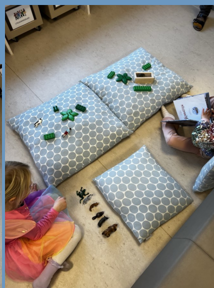
Dramatisering av Skinnvotten